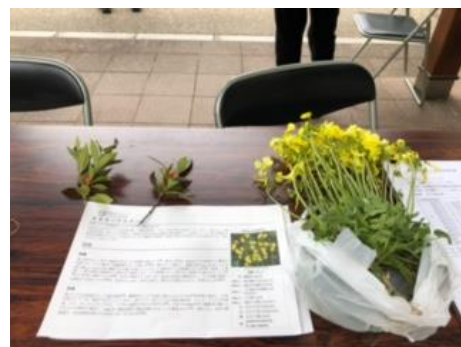
オオキバナカタバミ