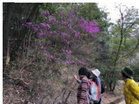
咲き始めたコバノミツバツツジ