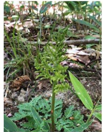
フユノハナワラビ