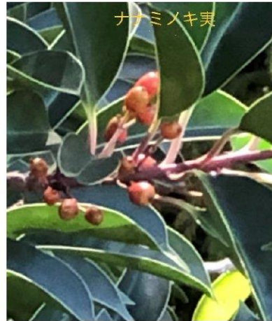
赤くなり始めたナナミノキ