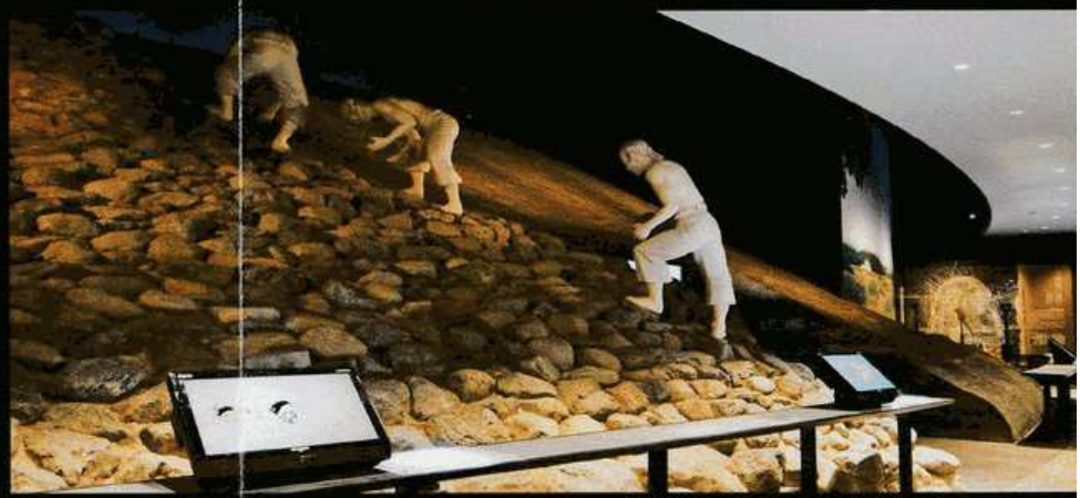
4 今城塚古墳の実像 I <巨大古墳の築造> 発掘調査を通じて明らかになった、巨大古墳の築造過程を実大ジオラマ等で解説。