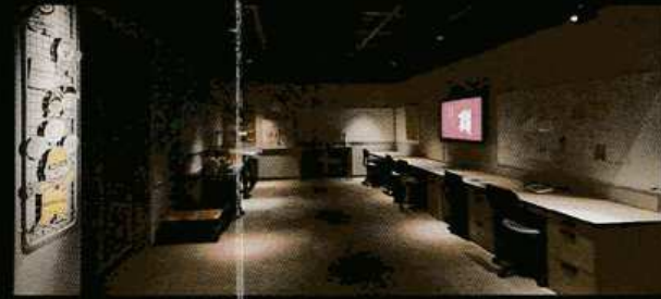
5 学芸員の部屋 古墳の科学探査や分析技術などを 通じて、学芸員の仕事を紹介。