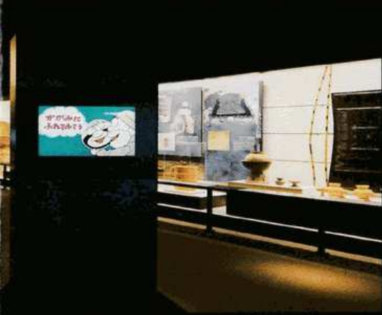
3 倭の五王と三島 巨大古墳の時代、埴輪窯と形象埴輪の紹介。

古墳公園に隣接する館内には、三島古墳群の概要をはじめ今城塚古墳の発掘調査で判明した、古墳づくりのさまざまな工夫を実大のジオラマ模型や映像も用いながら解説しています。実物の埴輪や豊富な出土品を通じて歴史遺産ネットワークの拠点としてさまざまな情報を発信する、歴史体験と学習の場です。