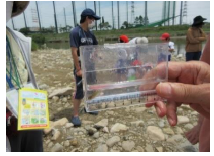
容器に入れて横から観察