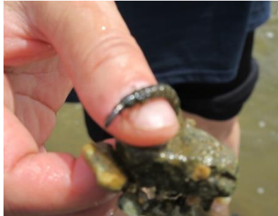
ヒゲナガカワトビケラの幼虫