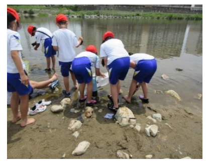
取った生き物は川に返そう