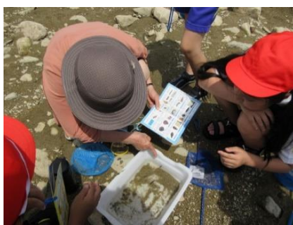
ハンドブックで名前を調べる