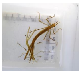
ハグロトンボの幼虫