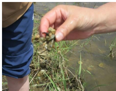
石に何かくっついてるよ