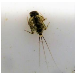
シロタニガワカゲロウの幼虫