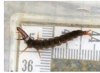
ヒゲナガカワトビケラの幼虫