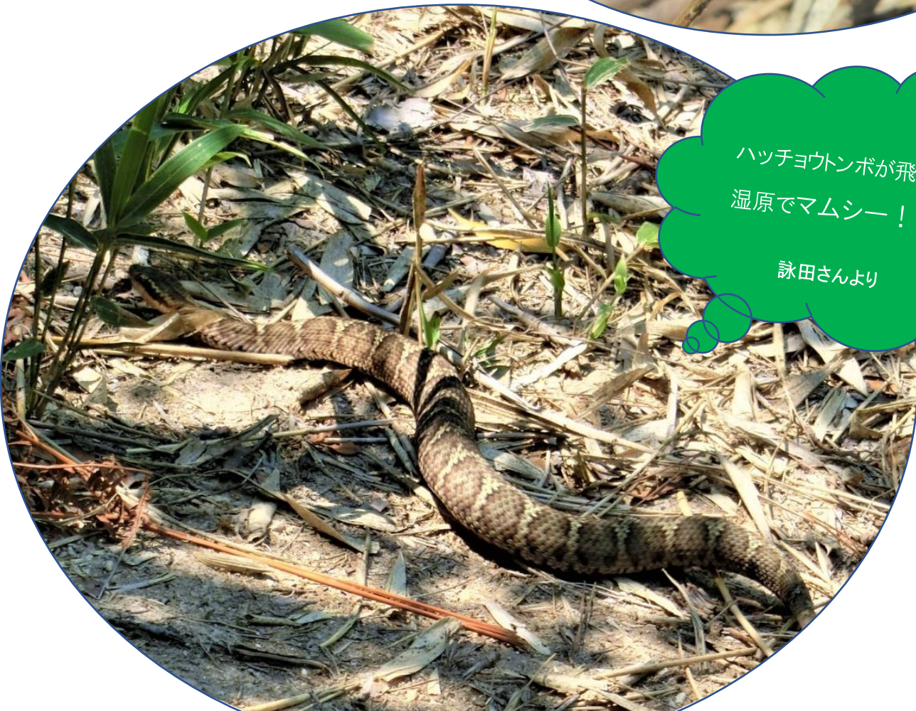
ハッチョウトンボが飛んでる 湿原でマムシー!!! 詠田さんより