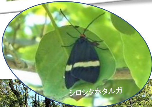
シロシタホタルガ