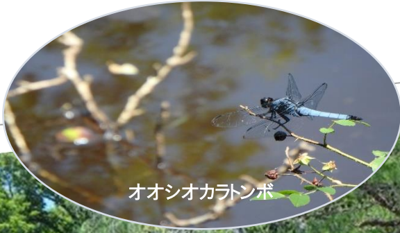
オオシオカラトンボ