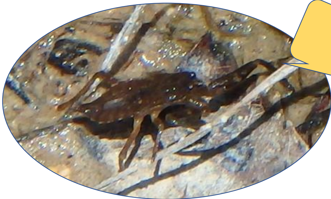
ヒメタイコウチ 西岡さんより