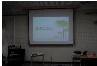
学習が終わって教室へ