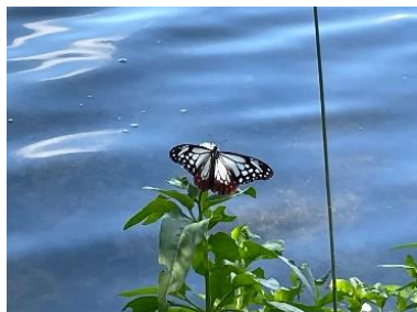
ミスヒマワリとアサギマダラ