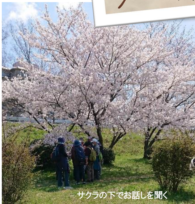
サクラの下でお話しを聞く