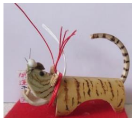
半田ごて・電熱ペンによる