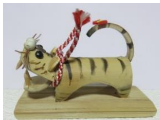
ローソクによるトラ柄