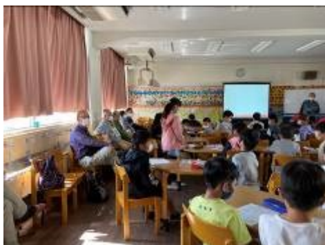
子どもたちの感想発表