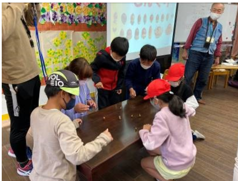
～ドングリで遊ぼう～ ♪ ドングリ回し大会 ♪