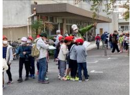
この木を見てみよう