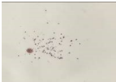
小さなケシのタネ