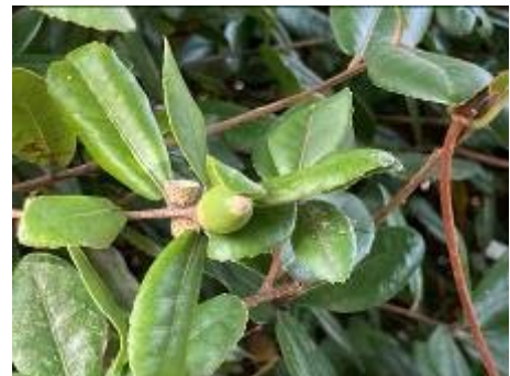
緑色のウバメガシ発見！