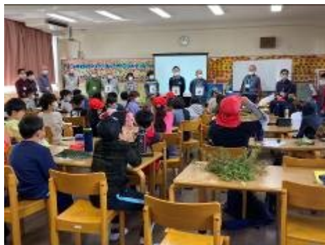
終わりのあいさつ