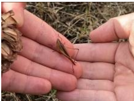
キリギリス科の「ホシササキリ」 木村(俊)さんによる同定