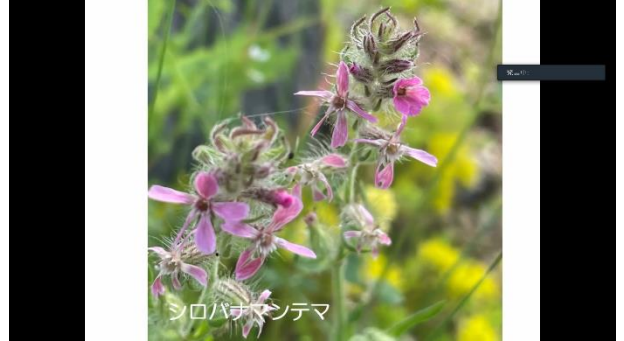
シロバナマンテマ