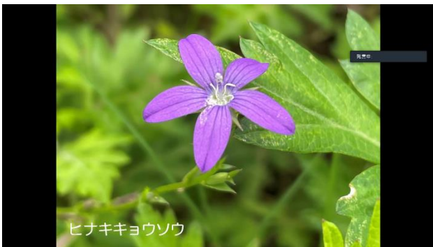
ヒナキキョウソウ