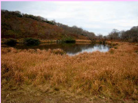
小女郎ヶ池で昼食