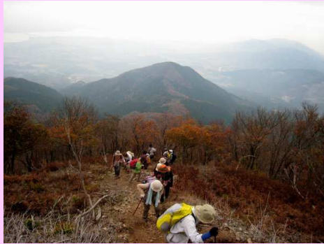
あと一歩で稜線へ