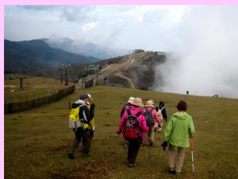
打見山へゲレンデを歩く