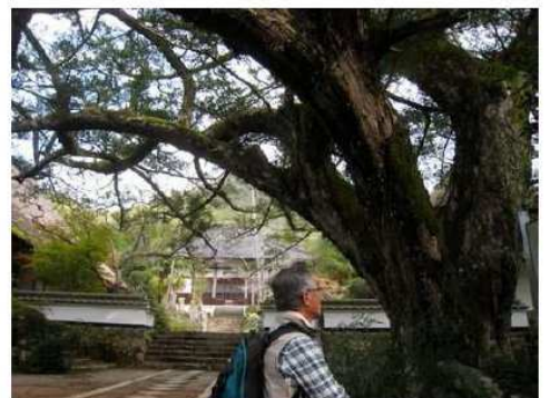
大舟寺のカヤの木