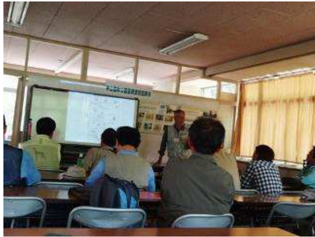
インプリテーション講義