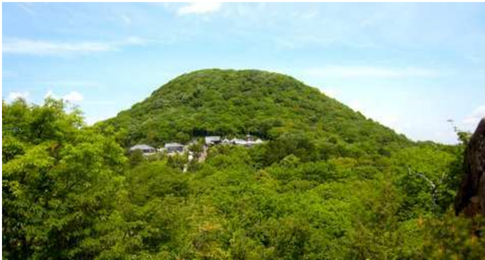
62 番札所からの甲山と神呪寺