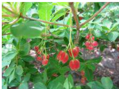
ベニドウダンの花