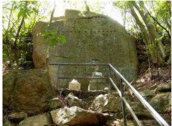
34 番札所、矢穴の跡が付いた岩