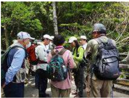
インプリテーション実習