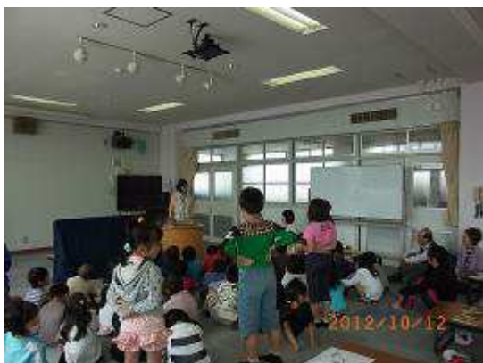
質問の時間です！難しい質問もありました