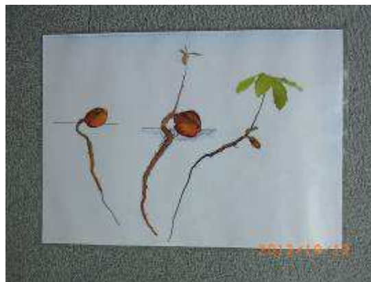
芽はどこから、どのように芽吹くかも勉強しました