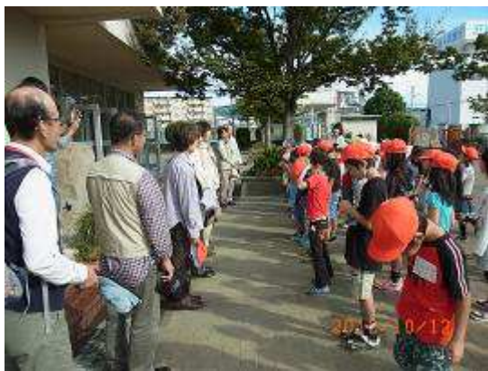
ご挨拶！よろしくお願いします