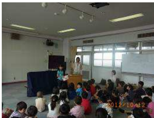
最後代表の児童のお礼の言葉で終了しました。