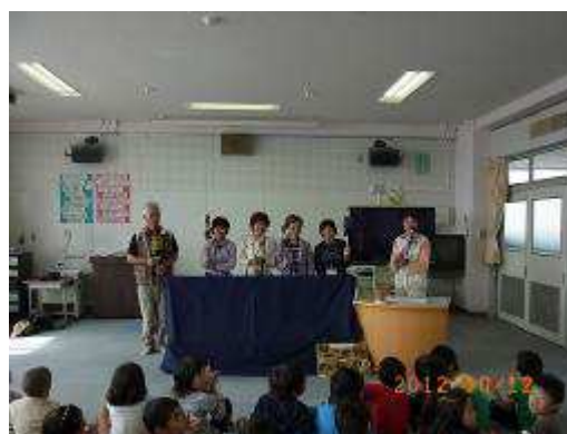
熱演者のMNCリーダーの皆さんです