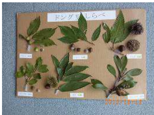
6種類のはっぱとどんぐり (教材用)

★ ～多目的室～ 2部： どんぐりしらべ …クヌギ、マテバシイ、ウバメガシ、コナラ、アラカシ、クリの6種類のどんぐりをパネルに貼ってコレクションをしました。