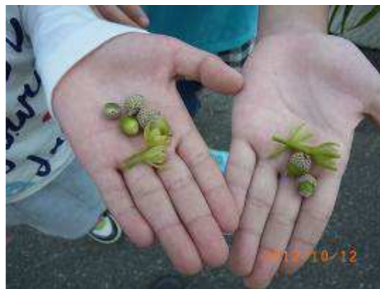
ほ～らかわいいでしょ！