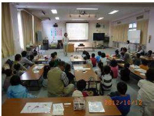
どんぐりについてお勉強しよう