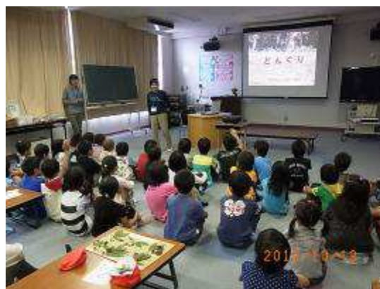
どんぐりと実についてお話です