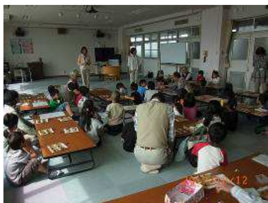
種類ごとによ～く観察しながら・・・