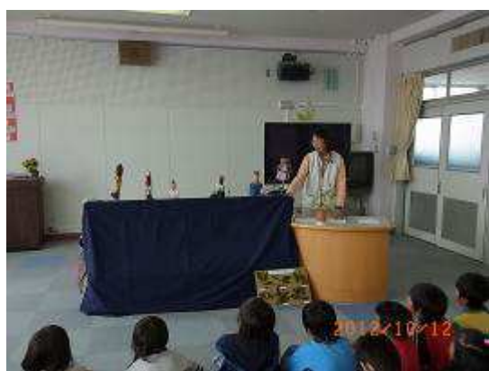
人形劇のはじまり！はじまり！