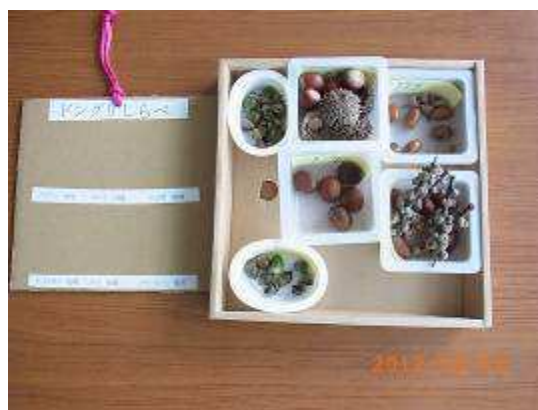
パネルと6種類のどんぐり