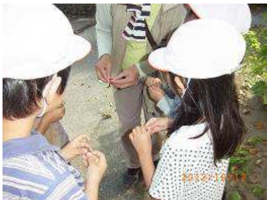
よ～く見てみようね