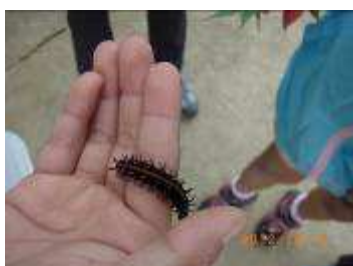
付録1 ツマグロヒョウモン幼虫