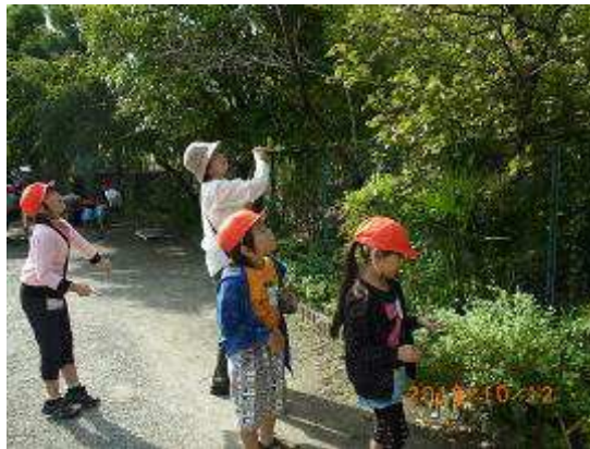
あれは何の実だろう？