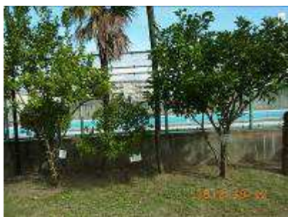
オレンジ・キンカン・ナツミカン