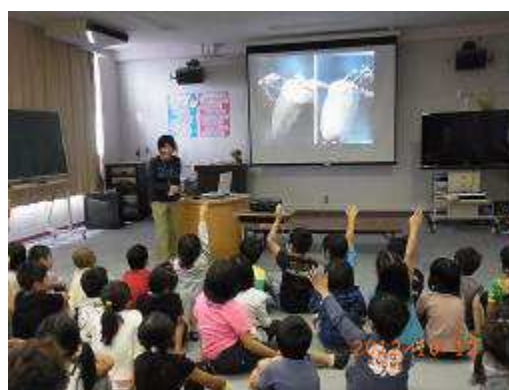
質問のある人・・・ハ～イ！ハ～イ！