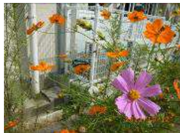
付録2 アオスジアゲハ