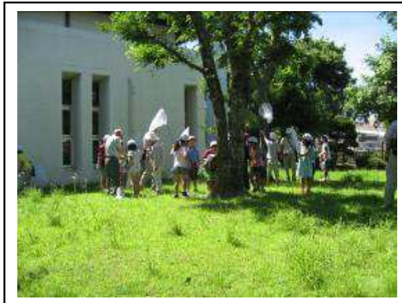
あっ、あつたよ 抜け殻