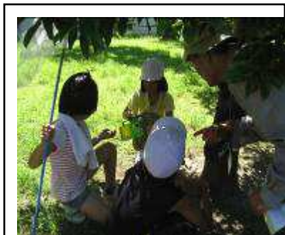
足がとれないように