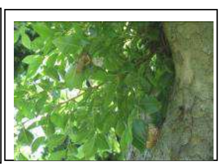
アキニレの葉の抜け殻