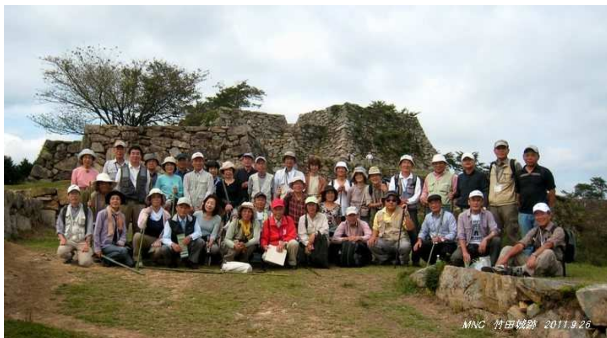
南千畳から天守を望む