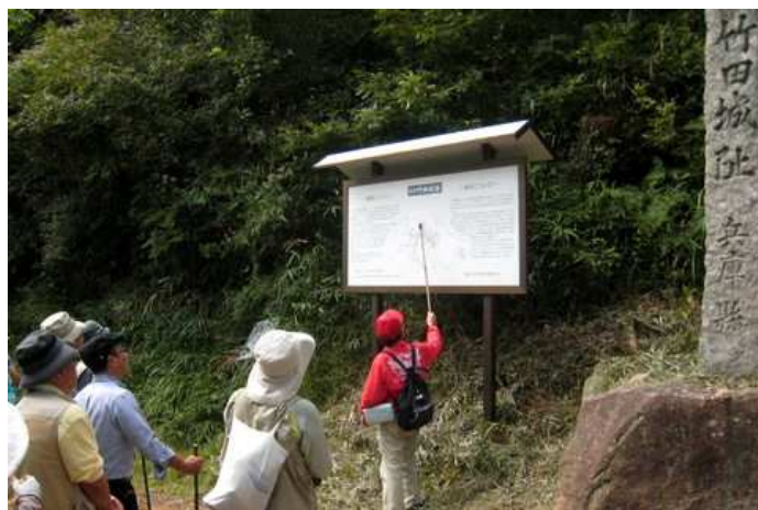
大手門で竹田城の歴史の説明