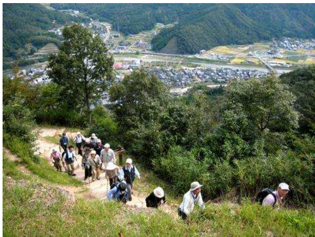
駅裏登山道を 40 分登る