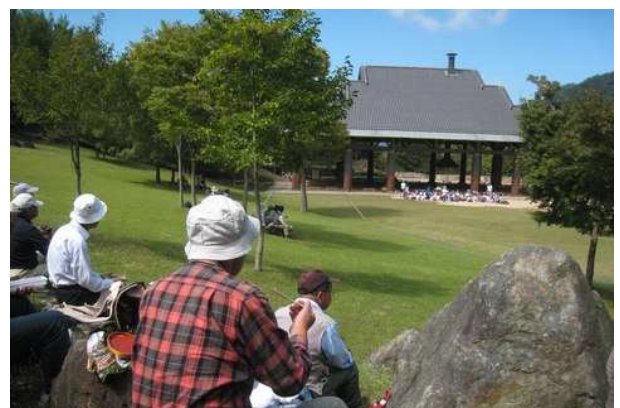
芝生広場から大屋根広場を望む