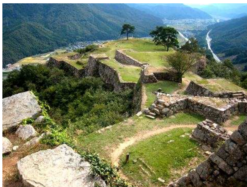
天守から南千畳を望む